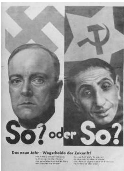
FIGURA 1 - Cartaz de propaganda nazista adverte os alemães sobre os perigos dos "subumanos" do leste europeu. Alemanha, data incerta.