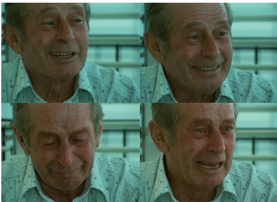
FIGURA 7 - Sequência do riso ao choro de Mordecai Podchlebnik.

Se torna aparente um rasgo no rosto, mesmo tendo retornado e encaminhado para o mundo novamente, mesmo passados mais de quarenta anos, o rosto que fora simbolicamente desfigurado vive na tela com uma grande ferida aberta.