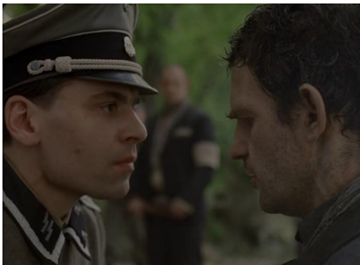
FIGURA 18 – O rosto do perpetrador contra o rosto de Saul. Fonte: O filho de Saul (2015) dir. László Nemes

Ao ser interrogado pelo verdugo sobre o ocorrido, Saul está ajoelhado diante da figura de autoridade sentada à sua frente. Após explicar que o prisioneiro havia perdido sua pá, o soldado se aproxima, abaixa-se ao nível de Saul e o encara, enquanto Saul mantém os olhos fixos no chão. Dessa forma, o algoz se reafirma de maneira dominante sobre Saul, evidenciando sua superioridade (Figura 18).