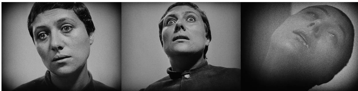
FIGURA 4 – Expressões de Joana D’arc interpretada por Maria Falconetti. Fonte: A paixão de Joana D’arc (1928) dir. Carl Theodor Dreyer

Por volta dos quatro minutos da diegese, vemos de um lado o conjunto de rostos dos representantes do Tribunal da Inquisição que interagem entre si com olhares julgadores, estando eles diante do rosto de Joana que se contrapõe em planos inferiores ao de seus algozes, atônito. O ajuntamento dos juízes e padres parece formar um só rosto, um rosto múltiplo, evidenciando a individualidade e o desamparo no rosto da jovem, que por sua vez, se transfigura em vários rostos: o rosto que chora, o rosto do medo, o rosto da morte (Figura 4).