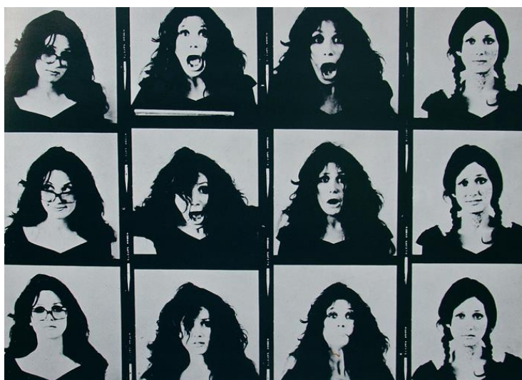
FIGURA 10 - Gretta Sarfaty, Auto-photos I , 1976.

Em Auto-photos (1976) (Figura 10 e 11), a artista utiliza diversas vezes a reprodução do próprio rosto, ao mesmo tempo que não se trata do mesmo rosto, mas sim de um instrumento representativo de todas as mulheres, que problematiza um ideário de beleza, os papéis de gênero e as expectativas sociais, oferecendo uma perspectiva mais ampla e diversa das experiências femininas. Por não se tratar simplesmente de autorretratos, Sarfaty optou pelo título Auto-photos , pois buscava explorar as diversas facetas e nuances da feminilidade para romper com estereótipos pré-estabelecidos e não necessariamente expressar uma individualidade 37 .