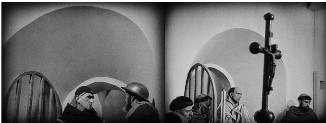
FIGURA 5 – Perspectiva de Joana D’arc. Fonte: A paixão de Joana D’arc (1928) dir. Carl Theodor Dreyer

Para a personagem de Joana, a autoridade terrena não possuía valimento, e em determinados momentos, vemos alguns planos em que as cabeças dos algozes estão na parte inferior da tela, revelando que o olhar de Joana transpassa seus carrascos e se eleva para o alto onde está seu Deus, que crê ser o único juiz (Figura 5).