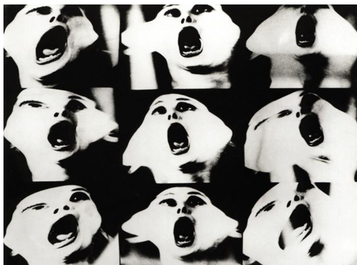
FIGURA 12 - Gretta Sarfaty, Transformations I, 1976.

Nestes trabalhos, a artista orienta o olhar do espectador para uma mudança, utilizando o efeito de aproximação focal da câmera, instigando o deslocamento do olhar para outro lugar, distanciando-o de um olhar que reduz, que objetifica, que sexualiza e convidando-o a enxergar a complexidade que se esconde por trás das aparências superficiais. Em Transformações I (Fig. 12) e em Transformações VIII (Fig. 13) é possível ver a abertura de sua boca em torções que seriam humanamente impossíveis, evidenciando uma expressão de horror.