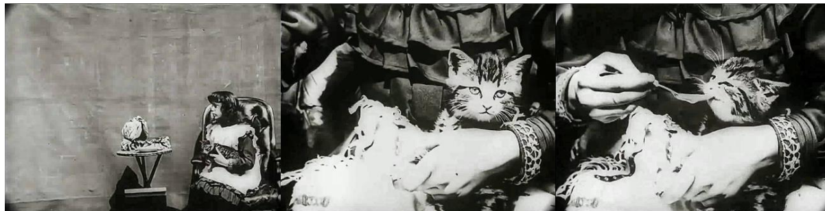
FIGURA 2 – Garota com gato no colo (Sequência de close-up ). Fonte: The Sick Kitten (1903) dir. George Albert Smith

Todavia, em 1903, o diretor inglês George Albert Smith em The Sick Kitten se utilizou de um dos primeiros close-ups do cinema. Smith inaugura com um plano mais aberto, com uma garota sentada em uma poltrona e que coloca um gatinho no colo e em seguida entra um garoto no quadro. Se comunicam, o garoto sai do quadro e retorna com um frasco que indica se tratar de um medicamento. Ao tocar o recipiente com o remédio, segue-se para um primeiro-plano de sua mão dando remédio ao gatinho com uma colher (Figura 2). O filme de Smith possui um simples arco, mas muito significativo como exemplo de como uma aproximação da câmera para mostrar um detalhe poderia enriquecer uma narrativa. A partir disso, no cinema se utilizou dessas ferramentas como modo de construir imagens conotativas munidas de sentidos que ultrapassam uma simples descrição.