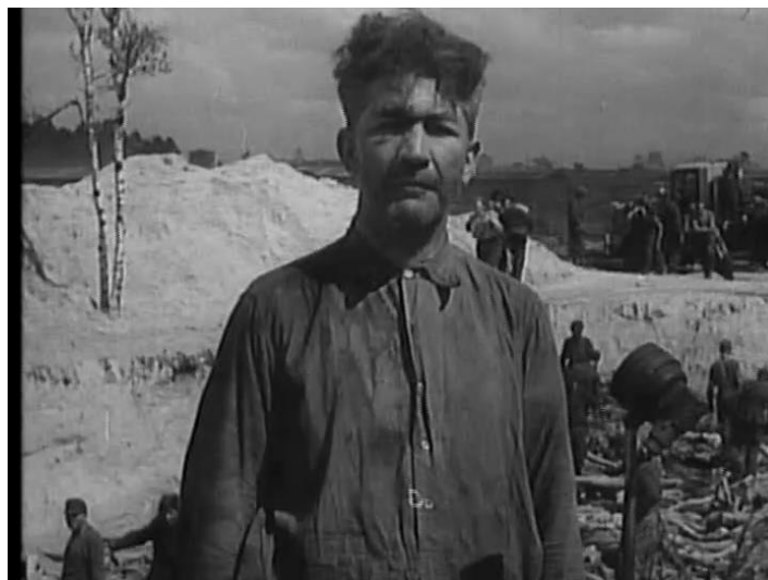
FIGURA 6 - Franz Klein.

Aos vinte minutos de documentário, surge a figura do médico nazista Fritz Klein (Figura 6) que foi mantido prisioneiro em 24 de abril de 1945, se apresenta para a câmera com informações básicas sobre si mesmo, incluindo seu nome, data de nascimento, idade e sua nacionalidade.