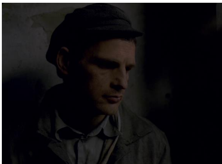
FIGURA 17 – Jogo de luz e sombra no rosto de Saul. Fonte: O filho de Saul (2015) dir. László Nemes

Aos quatro minutos de filme, Saul sai de um ambiente externo para um espaço interno, auxiliando na entrada dos recém-chegados no campo para o caminho da morte. Nesse instante, um jogo de luz e sombra obscurece seus olhos, como se estivessem vazios pela antecipação do que se desdobrará a seguir naquela fábrica mortífera (Figura 17). Por ele, passam aqueles que ainda desconhecem seu destino, caminhando da luminosidade para a escuridão, enquanto Saul é quem fecha a porta.