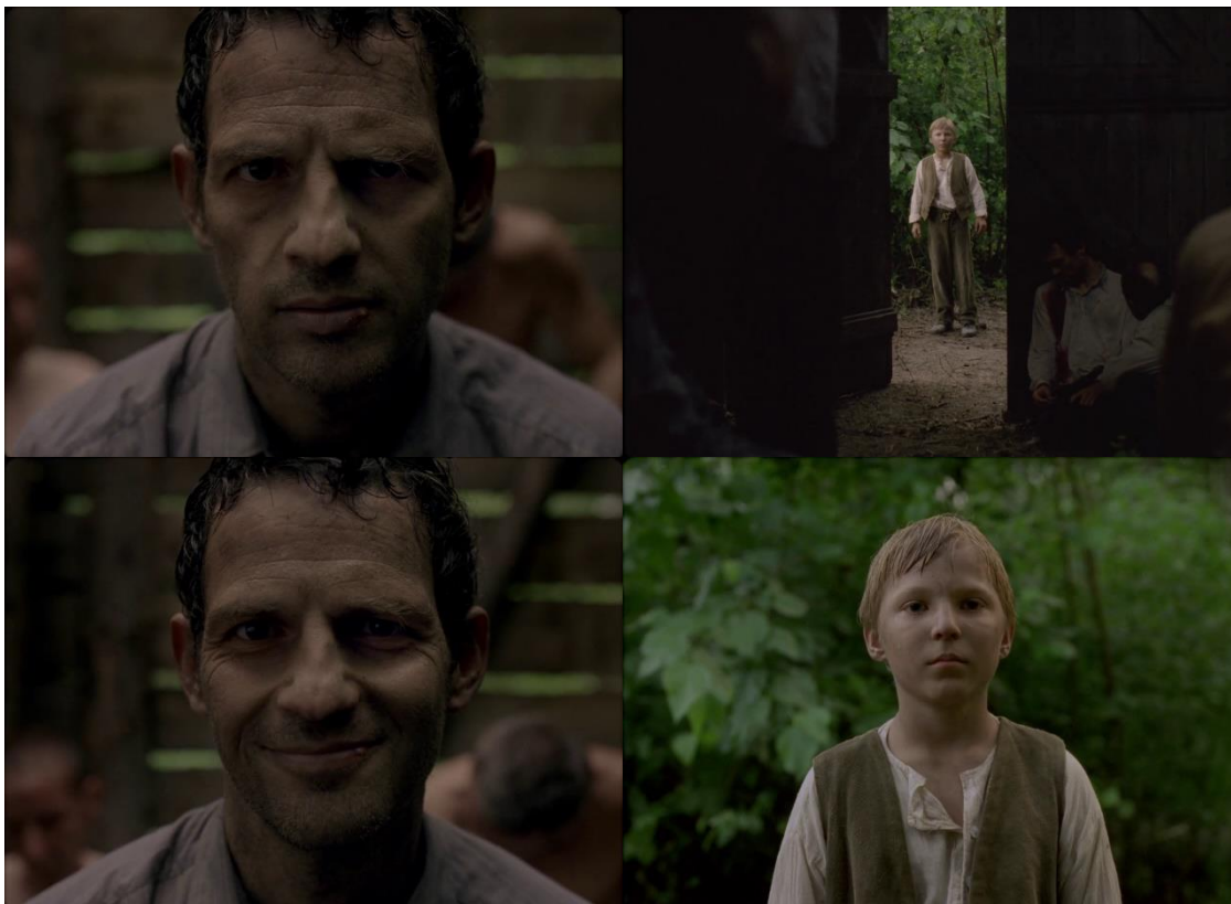
FIGURA 19 – Cena final. Fonte: O filho de Saul (2015) dir. László Nemes

Desde o início do filme, a câmera acompanha Saul, no entanto, no fim, a câmera olha uma última vez para ele enquanto vê um menino, possivelmente um filho que também o observa. Para Saul já não resta mais nada a fazer, então a câmera se desvencilha dele e corre atrás da criança. Em seguida, se fixa até o completo desaparecimento da criança.