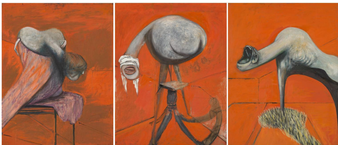
FIGURA 8 – Francis Bacon, Três estudos para figuras na base de uma crucificação. 1944. Óleo e pastel sobre compensado, 94 x 74cm.

A paixão de Cristo tornou-se central durante o desenvolvimento inicial da produção de Bacon, que embora não fosse religioso, também se debruçou sobre tema em obras posteriores. Bacon “[...] admite que o que lhe interessa no tema da Crucificação não é o drama religioso, tendo como personagem central a vítima divina, mas — para além do ato de carnificina objetivamente caracterizado pelo acontecimento — a posição espacial do Cristo enforcado elevado na cruz” (LEIRIS, 1983, p. 39, tradução nossa) 26 . Suas cenas de crucificação tendiam a incluir principalmente o abate, a carnificina e a mutilação da carne, o que para ele era do que se tratava a Crucificação: a barbárie do ser humano.