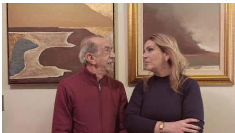
Foto: Divulgação/Maria Fernanda Calderari - Gazeta do Povo. Todos os direitos reservados.

O artista plástico paranaense Fernando Calderari morreu nesta madrugada de terça-feira, 14 de dezembro, aos 82 anos. Natural da Lapa, na Região Metropolitana de Curitiba, Calderari nasceu em 19 de fevereiro de 1939. A morte foi de causas naturais, de acordo com as informações de amigos dos familiares. Calderari deixa dois filhos, entre eles, a também pintora Maria Fernanda, e 2 netos.